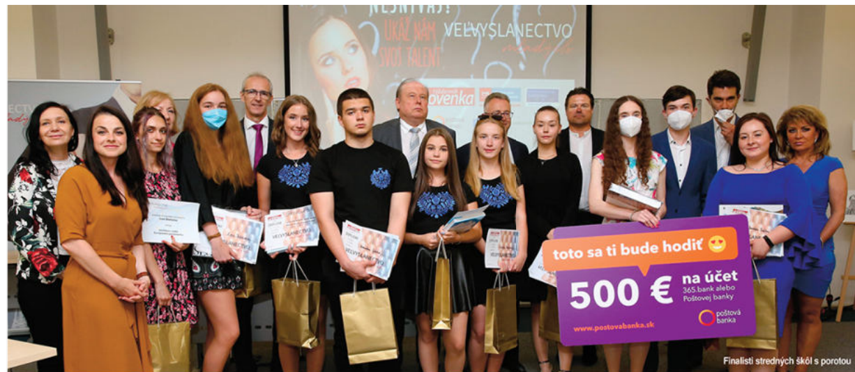
Finalisti stredných škôl s porotou

„Blahoželám študentom aj za ich jazykové znalosti. Takáto kvalitná angličtina a ruština, akú sme mohli počuť počas tohtoročného ročníka, tu ešte nezaznela. Myslim si, že je to aj odpoveď na mnohé kritiky nášho edukačného systému, ktorý napriek ťažkostiam smeruje na azaj správny smerom. Ale, aby som sa vyjadril k obsahu jednotlivých prác. Zastupujem BTB, teda sektor turizmu, ktorý sa práve v týchto časoch nachádza naozaj v ťažkej fáze. Aj preto veľmi oceňujem, že mnohé práce inšpirovala práve táto tematika. Vypočul som si veľmi veľa zaujímavých a podnetných myšlienok, ktoré môžu aj priamo pomôcť rozvoju tohto sektora. Pre mňa sú víťazní všetci.“